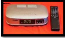
وحدة تحريك أوتوماتيكية