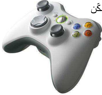
عصا التحكم اللاسلكية