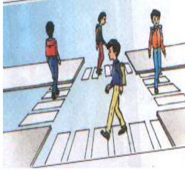
على المترجل أن