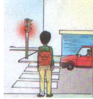
على المترجل أن