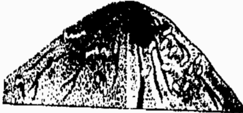
- B -