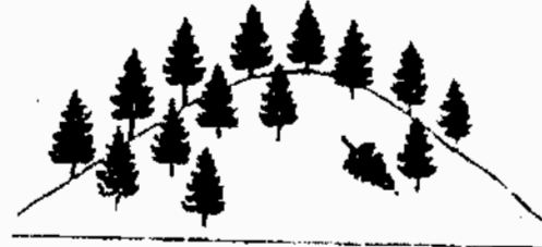
- C -