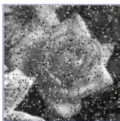
Image à filtrer